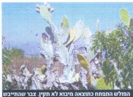
פולש התפתח כתוצאה מיבוא לא תקין. צבר שהתייבש