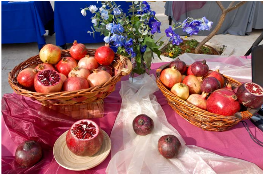
שנה טובה ומתוקה כרימון