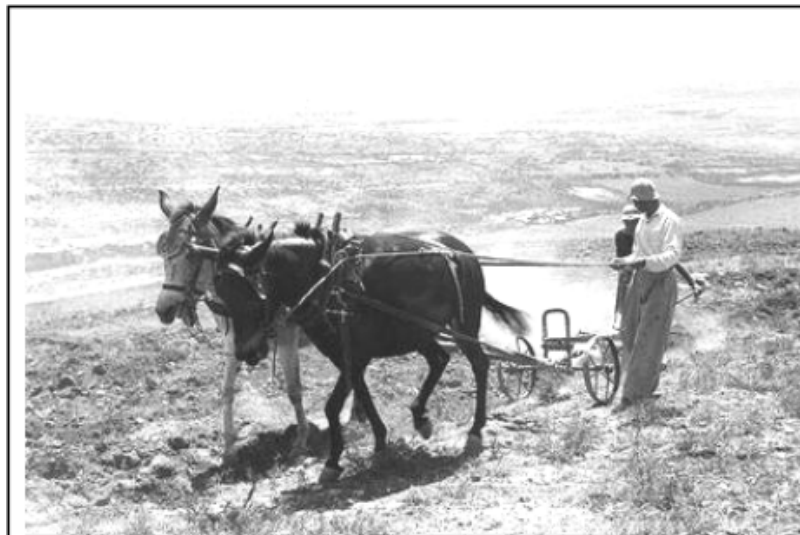
חלוצים חורשים בשדות קיבוץ כפר-צציון

החלום הרומנטי אודות לידת עובד אדמה יהודי בארץ ישראל המתואר באיורו של ליליאן אכן קרם עור וגידים במציאות המדברית הצחיחה והקשה בה נתקלו החלוצים. כך תאר את פועלם המשורר דוד שמעוני (שמעונוביץ') בשנת 1922: